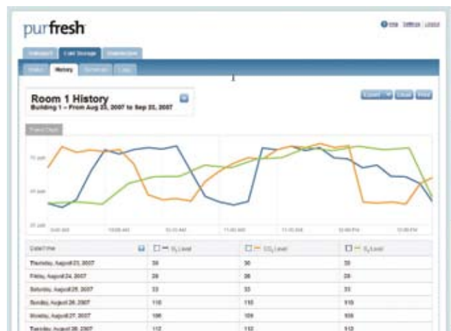
Grafici personalizzati per ogni singola applicazione che possono essere inviati via mail o stampati.